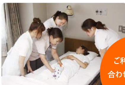
おむつ勉強会の様子